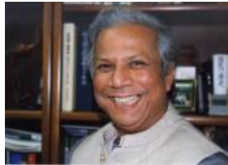
Prof. dr. Mohammed Yunus

Misschien niet vers van de pers dit nieuws, maar daarom niet minder belangrijk. Kort na het verschijnen van het allereerste exemplaar van onze nieuwsbrief kende in oktober 2006 het Noorse Nobel Comité de Nobelprijs voor de vrede toe aan professor Mohammed Yunus en de Grameenbank. Mohammed Yunus is de oprichter van de Grameenbank, een bank die zich ten doel stelt om armen die geen onderpand hebben te voorzien van een kleine lening om deze mensen zo de gelegenheid te bieden te investeren in een eigen, stabiele bron van inkomsten. Klinkt bekend? Inderdaad, stichting Creditino is geïnspireerd door en gebaseerd op het succes en belang van deze Grameenbank.