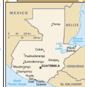
Hierboven de kaart van Guatemala